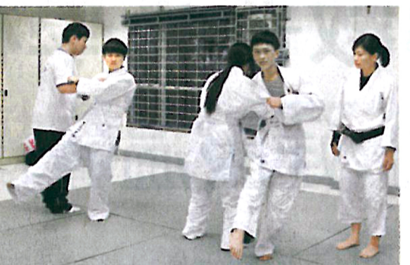
▲校方推行「一人一活動」，學生透過柔道強身健體，同時修練意志。