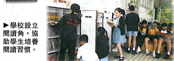
學校設立閱讀角，協助學生培養閱讀習慣。