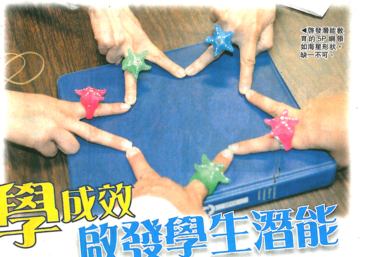
啟發潛能教育的5P綱領如海星形狀，缺一不可。

學生在求學階段不應只增加知識，還該得到啟發，發展個人潛能。近年，愈來愈多本港和內地的學校，主動開展啟發潛能教育 (Invitational Education, IE) 工作，把當中的基本信念與5P綱領引進，成為校內的教育策略，並在全校不同領域實踐。今天起一連3天 (11月14日至16日)，國際啟發潛能教育聯盟 (IAIE) 藉着在香港舉行的2012國際啟發潛能教育聯盟世界會議暨啟發潛能學校大獎頒獎禮，頒發2012「啟發潛能學校大獎」(Inviting School Award) 給首度推行IE，且在校內建立IE文化，以及能在各範疇貫徹相關理念的學校，表揚這些學校付出的努力。