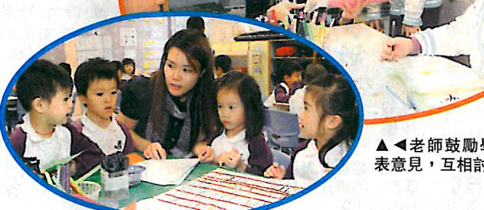
▲老師鼓勵學生發表意見，互相討論。

就以設計故事書封面為例，草圖正是學生們經過討論後，在彼此同意的情况下繪畫出來，充份體現了溝通、協作及創意的3C精神。學生要有自己的構思，也要懂得理解別人的構思，亦要為彼此的構思作出討論，同時要有互相尊重與包容的能力，懂得顧及別人的感受，其後亦要分工合作完成整個作品。目的是讓幼兒在長大後，擺脫自我中心的困局，能易地而處尊重別人的想法。