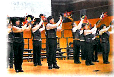
▲學校經常參與不同形式的社會服務，不但走進社區，還身體力行回饋社區。