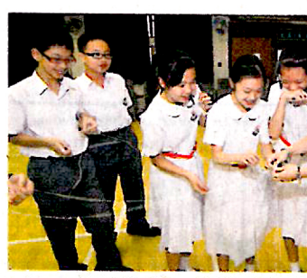
▲中一同學與老師一起參與活動