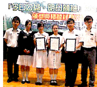
▲學校同學於「今日公益、明日領袖」計劃中榮獲「優秀社會服務獎」及「裕元優秀社會服務獎」兩大獎項。