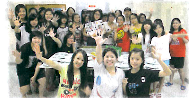
▲宿生舉辦生日會，增進同學之間的友誼。

宿舍導師籌備很多小組或群體活動，例如有「雜耍小組」、「美食製作小組」、「香薰治療小組」等；又會舉辦「男子混合足球賽」、「沙灘排球賽」等等，男女皆宜、有動有靜，而且在玩樂的性質中加添大量引發個人潛能和培養團隊合作的元素，寓教育於活動中。因此很多宿生都很活躍、而且社交技巧和協作能力都有明顯的提升。