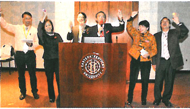
實踐IE，令聯盟(香港)將成為美國總會與亞洲各地方學校的橋樑。

展望IE在香港的發展，朱會長表示聯盟(香港)將繼續主力協助本地中學、小學、幼稚園和特殊學校推行IE。接下來，也會積極幫助亞洲其他地方的學校