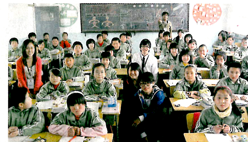
▲學校每年舉辦多個本地、內地及國外交流團，如安排學生到內地義教，讓學生增廣見聞、擴闊視野。

可道中學(齋色園主辦)深信「人是學校最重要的資產」，學校應幫助學生發揮潛能、培養品德，並增強各成員對學校的歸屬感，因此致力推行「啟發潛能教育」(IE)，優化校園設施，為學生提供優質的學習環境，刻意安排機會讓學生發揮多元潛能，又推行一系列政策，營造「尊重」、「信任」、「樂觀」的校園氣氛，令學校成為師生另一個家。校方推行IE以來成效顯著，早前更獲頒「啟發潛能學校大獎」表揚成果。