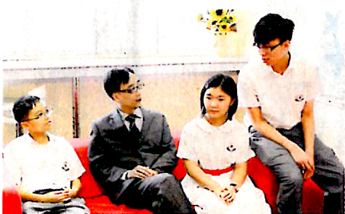
▲劉校長平易近人，常主動與學生傾談。

此外，學校亦期望學生得到全人發展，有機會發展多方面的潛能，所以為學生提供不少特別的課外活動，如舞獅、中國舞、射箭、武術等，並鼓勵學生積極參與比賽應用所學，藉此啟發學