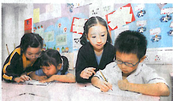
學生之間樂於互相指導功課

校方深知在地方 (Place) 層面，並非只講求美化校園環境，增加學生的舒適感；還需要優化學習設施，豐富學習環境，提升學生的學習動機。因此，學校著力在校園不同的位置設立閱讀角，培養學生良好的閱讀習慣。此外，在近校門口擺放