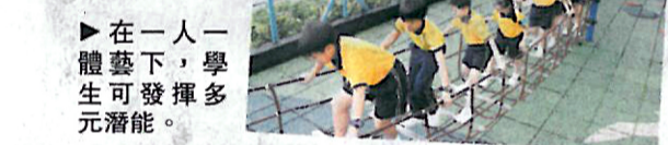
在一人體藝下，學生可發揮多元潛能。