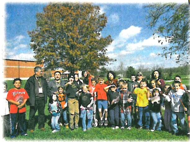
▲出席一連3天活動的逾1,300名教育界人士，一起慶祝聯盟成立30周年。圖為紀念30周年的標誌。

今年是國際啟發潛能教育聯盟成立30周年。回顧1982年，包括Dr. William Watson Purkey的多名著名教育家在美國創立此組織，積極提倡在學校推行啟發潛能教育，當中的基本信念主張採取「尊重」(Respect)、「信任」(Trust)、「關懷」(Care)及「樂觀進取」(Optimism)態度，建立正面校園文化，配以「刻意安排」(Intentionality)的教育策略，透過「人物」(People)、「地方」(Place)、「政策」(Policy)、「課程」(Program)與「過程」(Process)構成的5P綱領，啟發學生全面發揮個人潛能。