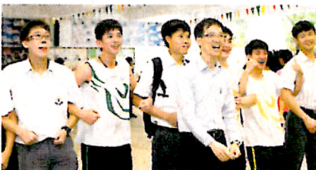
▲學校師生關係融洽

學校推行IE的「政策」之一是發展關愛校園，並以三年計劃循序漸進達到目標，於2009至10學年致力加強班內的凝聚力，鼓勵同學互相關顧和支持，於10至11學年則由班內推廣至全校性的關愛行動，並於11至12學年進一步鼓勵同學積極參加社會服務，務求將校內關愛精神逐步推展至社會層面。為打造關愛校園，校方致力推行相關「計劃」，舉行一連串活動營造班內互相關顧的氣氛，包括舉辦迎新活動，讓新生盡快適應校園生活，以及一系列挑戰營，藉此增進師生關係及同學之間的友誼。校方亦會刻意與學生慶祝各個節日，藉此讓學生感受到學校這個大家庭的關愛和溫暖。另外，校方亦在「地方」上花心思，