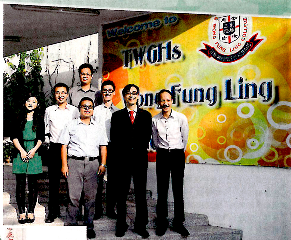
▲由學校老師組成的「IE委員會」，致力打造關愛校園、提升學生自信，助學生發揮潛能、做得更好。