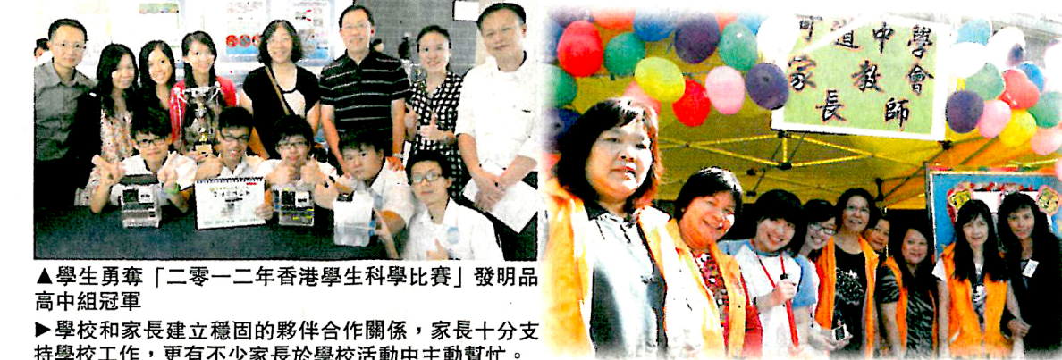
▲學生勇奪「二零一二年香港學生科學比賽」發明品高中組冠軍 ▲學校和家長建立穩固的夥伴合作關係，家長十分支持學校工作，更有不少家長於學校活動中主動幫忙。

彭校長總結，要令師生接受新事物需時，因此實行IE要逐步推展，讓學校各持份者漸漸感受IE的效能，從而認同及接受。現在全校師生已將IE融入校園生活之中，成功建立互相關懷的習慣和文化。透過學校通力合作，和諧、充滿關顧的校園氣氛得以建立，學校亦成為眾人的另一個家。