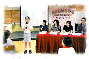
▲學校特設「校政交流會」，由學生一人一票選出「級社代表」，直接向校長及參與行政策劃的人士表達意見。

願意嘗試和參與的學生，也有被肯定和獎勵的機會。「學生豈可只有在學業成績上有被獎勵的機會，引入IE後，學校更刻意經營「計劃」和「過程」，令學生的態度及品格改善，也有被獎勵的機會，令學生充滿成功感，更有自信。」