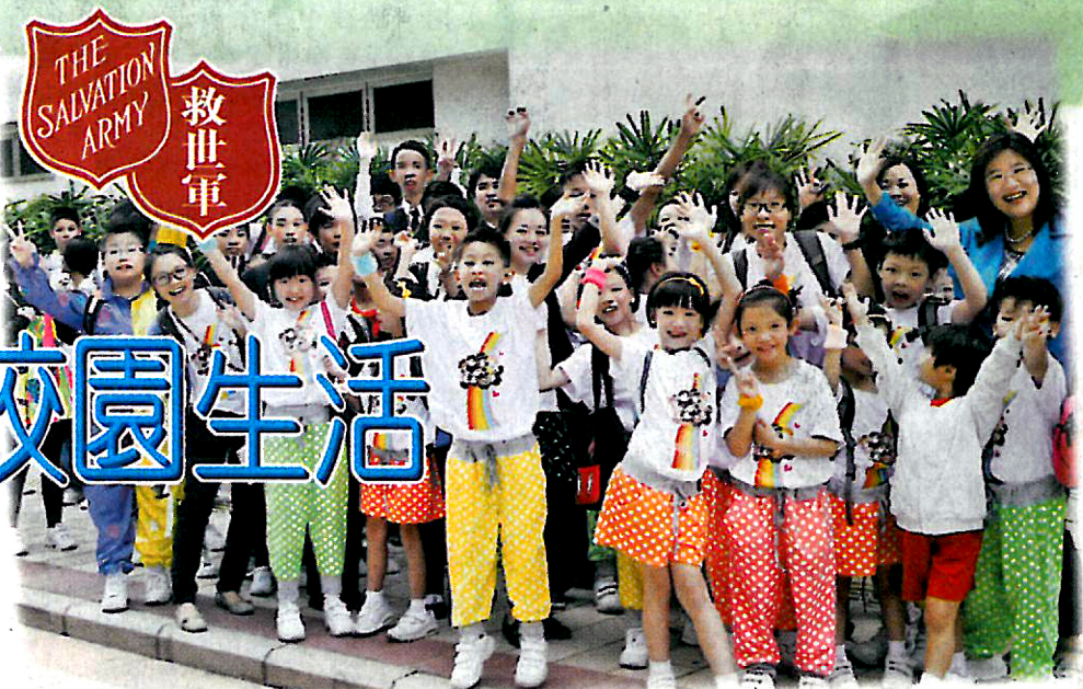
▲學校在十月份帶領眾多的學生在大埔及北區舉辦兩次地區匯演，讓學生發揮潛能，為社區服務，更將共融的訊息於社區展現。

IE強調5Ps，包括「人物」（People）、「環境」（Places）、「政策」（Policies）、「計劃」（Programs）及「過程」（Process）。歐淑芳老師指出，該校在引入IE之初，是先以最密切而又最重要的「人物」及「環境」入手，結合校董會、教職員及家長等所有持份者的支持，在課堂內、外為學生創造成功的機會及歷程，令學生努力的成果得到讚賞及正面肯定的評價。