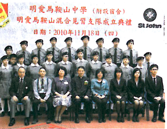
▲成立聖約翰救傷隊，鼓勵學生關懷社會，服務別人。

要有好的果實，必須先有好的土壤；要有好的人才，必須先有好的老師。該校老師明白要學生成才，就必須先讓學生歷練和承擔，因此，在經營班級文化時，該校十分強調老師的指導角色。「一人一職」是起點，在班中設立幹事會，由班主任指導學生如何組織班會活動，如籌辦旅行、訂立班規等，強化學生的責任感及自主權；再配合「班際龍虎榜」的設立，透過各類競賽，如壁報設計、球類比賽、朗讀比賽、問答比賽等，除增強班際凝聚力外，亦讓更多學生成為精英領袖。該校重視「以人帶人，以心連心」的承傳文化，正是5P中「人物(People)」的精神。