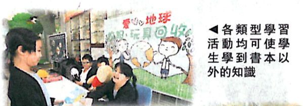
各類型學習活動均可使學生學到書本以外的知識

談及獲獎感受，關校長感恩說道：「這個獎項又一次見證神的恩典是何等豐盛，遠超我們所想所求。我期望在油塘基顯這片土地上，能看到IE的工作不斷開花結果。學校每個持份者都更愛學校，更快樂和更自信，各人的生命素質都不斷提升，潛能得以啟發。」