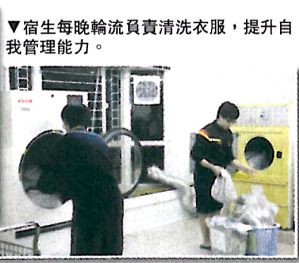
▼宿生每晚輪流負責清洗衣服，提升自我管理能力的。