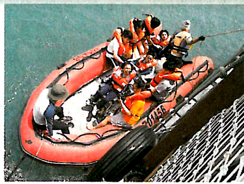
▶學生參與共融活動「乘風航」