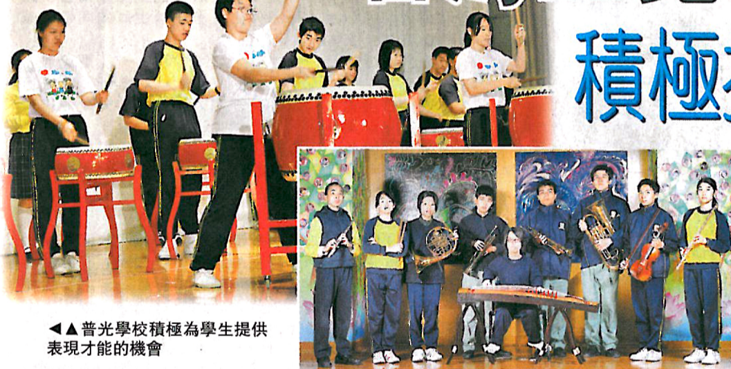
普光學校積極為學生提供表現才能的機會

香海正覺蓮社佛教普光學校 (下稱「普光學校」) 認為先天的限制不是一切，即使智力發展和一般學生有差異的孩子，亦不應限制他們的發展空間。二十多年來，普光學校一直持守「盡心竭力，自強不息，培育弱智學子，發展潛能」的教學宗旨，透過不斷革新課程及教學手法，為有需要的學生建設合適的學習環境。雖然在2009年才加入「啟發潛能教育」計劃 (IE)，但該校早已採用類似的教育理念多年，故此在推行IE時更為得心應手，並於今年首次得到國際啟發潛能教育聯盟的肯定，獲頒發2012年度國際啟發潛能教育學校大獎，表揚該校在過去一年推行IE的成果和努力。