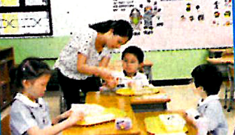
▲不同形式的關顧服務，能為學生創造成功感，令他們更投入學習生活。

開學時才開始排練，短短的時間能在台上表演得既有板有眼，令教職員、家長及社區人士都留下深刻的印象。校長張慧儀指出，對於是次獲得「國際啟發潛能教育大獎」，最重大的意義是證明校方引入了一個兼具策略的教學理念，校內歡愉及彼此關心的氣氛變得更為濃烈。她強調，IE並非只讓學生得益，教職員及家長都同時可從推動IE的過程當中得到正面的轉變，「我們很高興可以見到學生在多方面表現上有所提升，