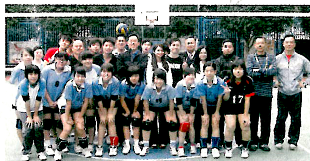
▲學校推行一系列「班級經營」活動，如師生排球比賽，務求從班本著手，促進師生及學生之間的感情。

除此之外，學校舉辦多個本地、內地及國外交流團，如四川、河北、台北、新加坡等，讓學生增廣見聞、擴闊視野，辦學團體每年更會提供大量資助，學生只需繳付四成費用，務求讓家境一般的學生亦有機會參與。學生對交流團的反應踴躍，上學年參與交流團的學生多達132人次。