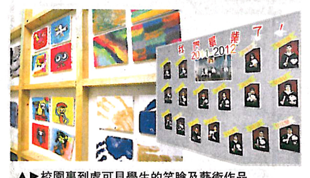
校園裏到處可見學生的笑臉及藝術作品