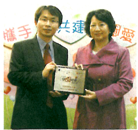
▲明愛馬鞍山中學在2009至2011年連續三年獲得關愛校園榮譽，建立了關愛校園文化，推行IE時更加事半功倍。

天生我才必有用，學校深信每位學生均具備不同的才能；世有伯樂，然後有千里馬，若學校提供多元的學習機會，定能啟發學生潛能，盡展所長，在人生路途上發放光芒。明愛馬鞍山中學著重培育學生六育，讓學生有均衡發展。近年引入美國「啟發潛能教育」(Invitation Education, IE)的教學理念和策略，「刻意安排」學生參與不同的學習計劃和課外活動，學生無論在學業或在個人成長方面均有顯著進步。經美國及本港教育專家評審後，該校榮獲國際啟發潛能教育聯盟頒發「2012國際啟發潛能學校」殊榮，對各持分者的努力加以肯定，成就有目共睹。